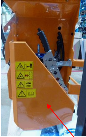
Bestellung mit Streuteller 99577810