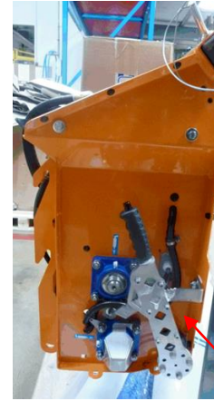
Bestellung ohne Streuteller 99577810